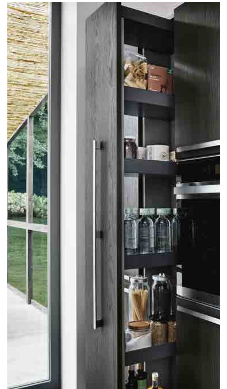
Colonna estraibile Arena Style Kesseböhmer in finitura antracite. Arena Style pull-out column of Kesseböhmer in a coal-grey finish. Colonne extractible Arena Style Kesseböhmer en finition anthracite.