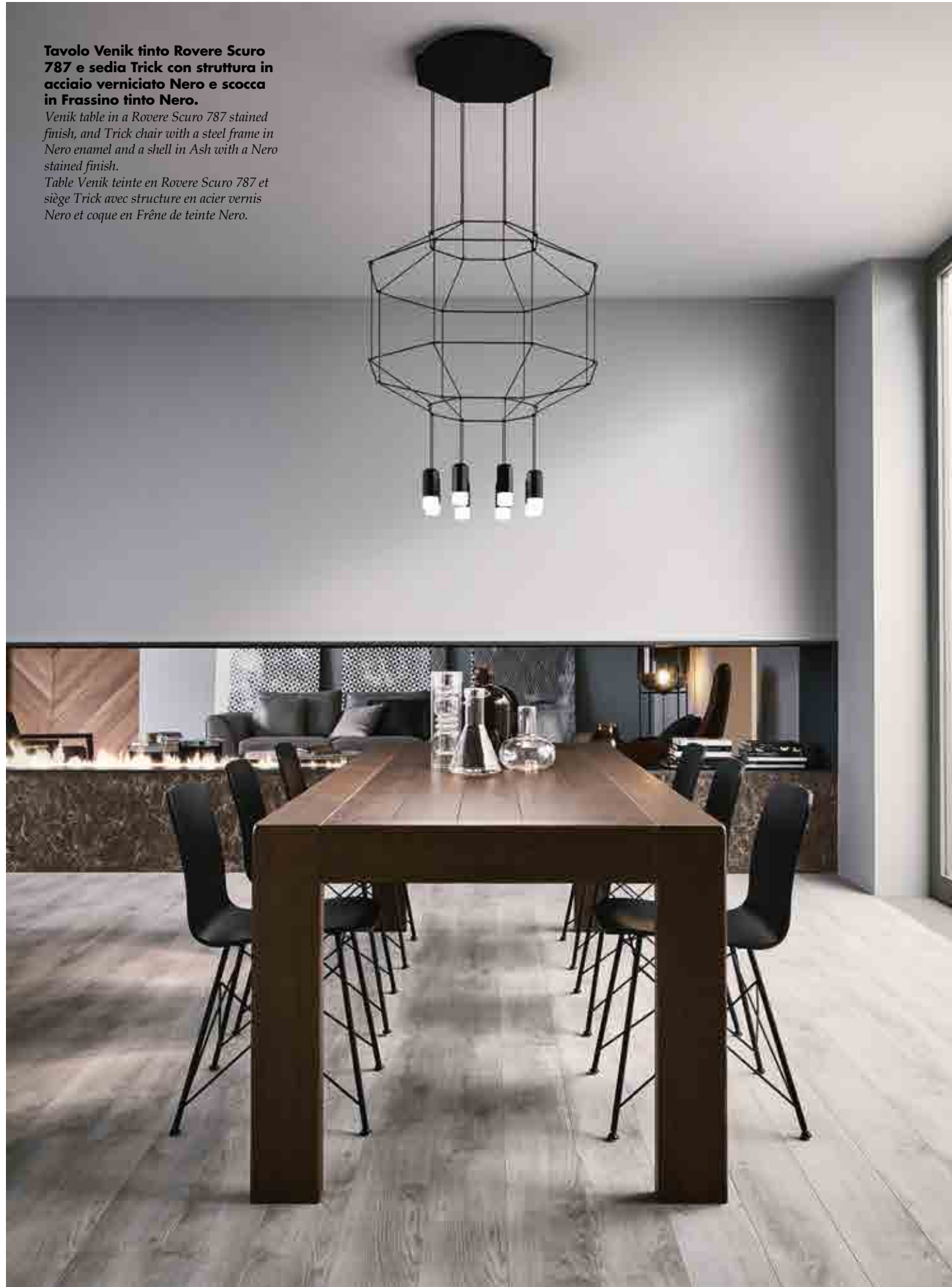
Table Venik teinte en Rovere Scuro 787 et siège Trick avec structure en acier vernis Nero et coque en Frêne de teinte Nero.

Venik table in a Rovere Scuro 787 stained finish, and Trick chair with a steel frame in Nero enamel and a shell in Ash with a Nero stained finish.