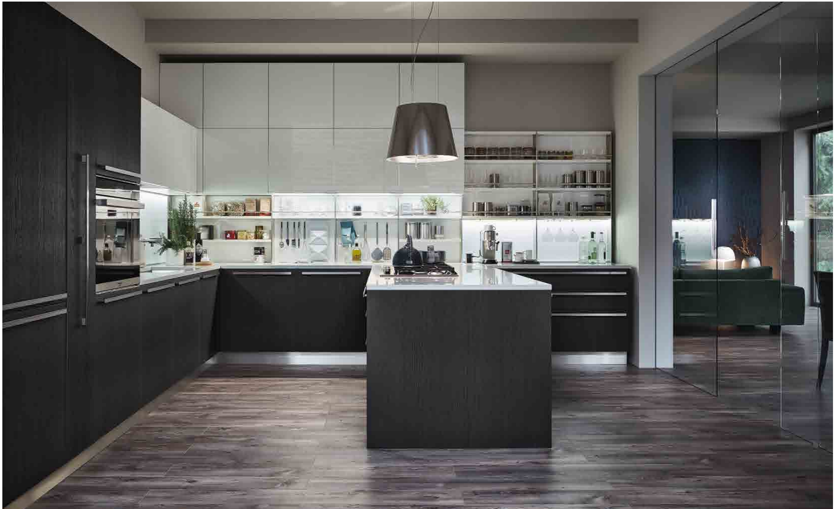
EXTRA. CUCINA ROVERE GRAFITE 792 E LACCATO BIANCO PURO LUCIDO 214. MANIGLIA STRINGA. TOP IN QUARZO STARLIGHT WHITE Q25.