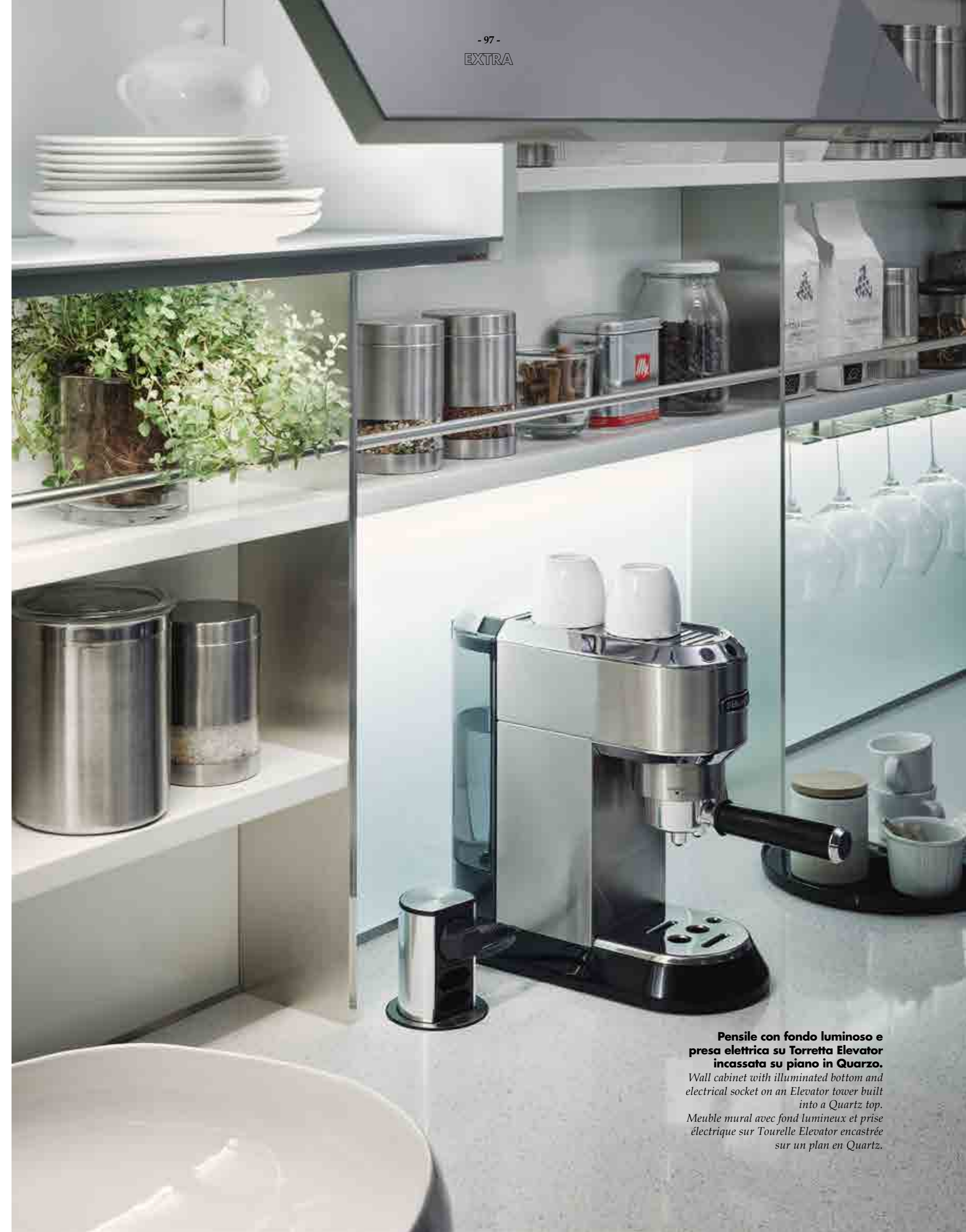
Pensile con fondo luminoso e presa elettrica su Torretta Elevator incassata su piano in Quarzo. Wall cabinet with illuminated bottom and electrical socket on an Elevator tower built into a Quartz top. Meuble mural avec fond lumineux et prise électrique sur Tourelle Elevator encastrée sur un plan en Quartz.