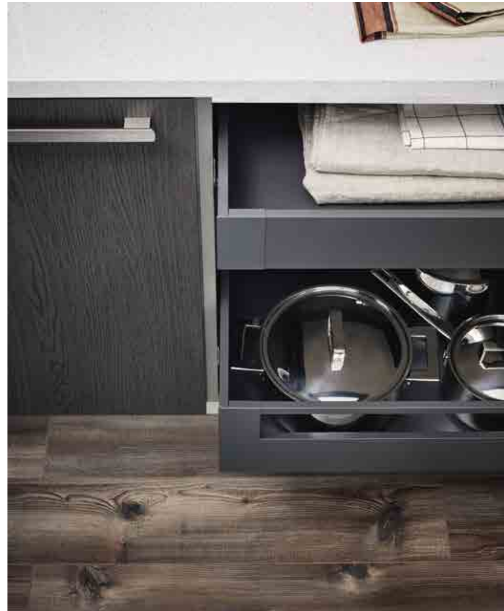
Anta con cassetto e cestone estraibili. Door with pull-out drawer and pan drawer. Casier avec tiroir et casier extractible.